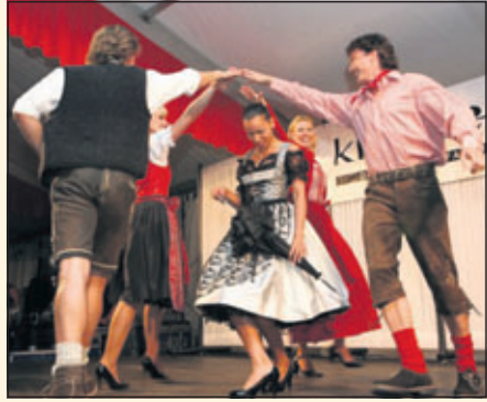
So ist's recht! Dirndl und Lederhose beim Volkstanz – aber nicht auf dem Wasen.

Ich gestehe: Auch ich trug Lederhose. Mit Lust und Passion, mit Begeisterung und Überzeugung. Damals war ich sechs, vielleicht acht oder neun Jahre alt. Die knielange Hirschlederhose war voll geil – im heutigen Jargon der Jugend gesprochen. Wochenlang knirschte sie zwar beim Gehen und Bücken, scheuerte Kniekehlen und Oberschenkel wund. Dann wurde sie endlich weicher und weicher und weicher. Das Übergeilste waren aber die Hosenträger, die hatten einen röhrenden Hirsch vorne drauf. So was gefällt einem Kind.