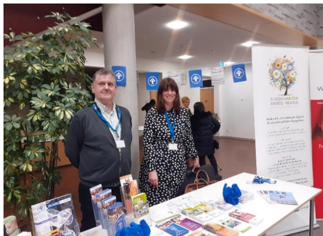
Vorstellung des Kinderschutzbundes und