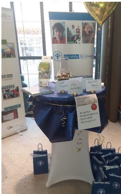
Ehrenamtsbörse im Rathaus am 8.02.2019 deren Elternkurse in Kernen